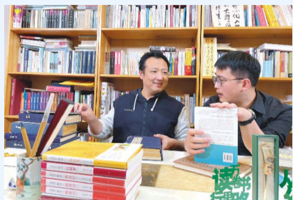
中国诗词大会出题人李天飞为孩子们讲解四大名著