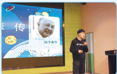
公益读书会进校园

阅读是获得知识的一种最基本、最重要的途径。长期以来,语文教学一直处于重课内轻课外、重知识消理解轻阅读感染熏陶的尴尬境地。约读书房作为专业的阅读推广机构,用校外阅读做校内阅读的拓展与延伸,以兴趣促发展,用经典拓广度,靠分享强表达,成为推动当下少年儿童海量阅读的着力点。