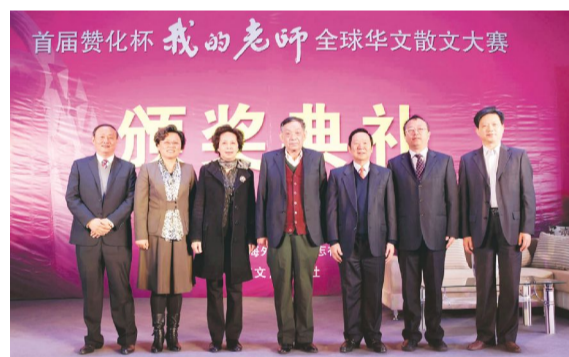
首届“赞化杯”散文大赛颁奖典礼