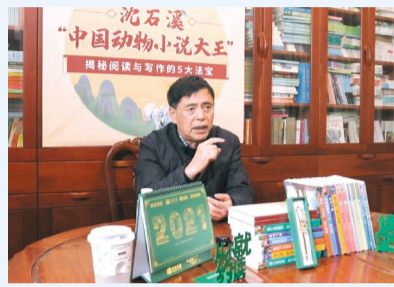
动物小说大王沈石溪揭秘阅读与写作的五大法宝