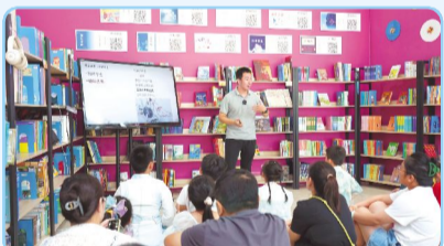
刘老师图书馆活动