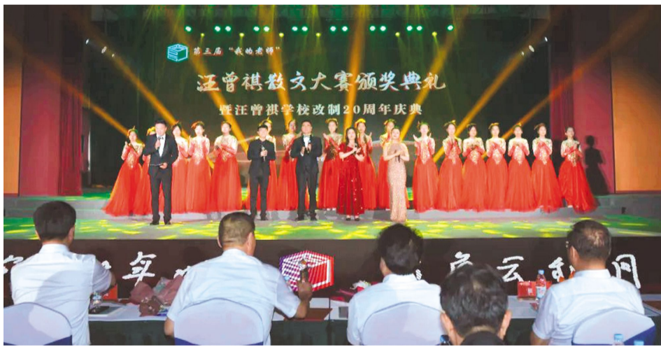
学校改制20周年庆典