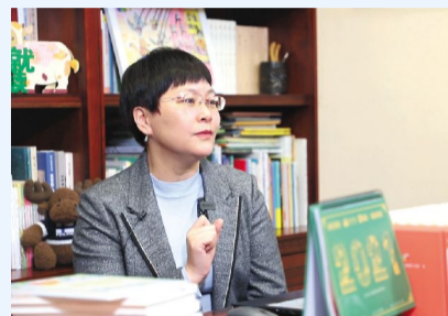
跟国家一级作家汤素兰学观察、想象与表达

阅读是人民群众最基本的文化权利,也是最为普遍、最为持久的文化需求。约读书房创立于2012年,在全民阅读大背景下应运而生。公司以阅读为核心,经营业态涵盖阅览、售书、借阅、零售、儿童读书会、大人读书会、名家讲座、研学、社会实践等,致力于为少年儿童创造良好阅读环境,培养良好阅读习惯。