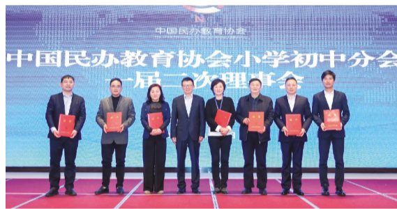
金开明董事长参加民办教育会议