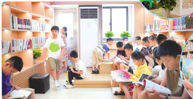
约读书房门店实景

未来,约读书房将继续秉持阅读推广初心,发挥行业优势,将科技与阅读相结合,扎根社区,直通家庭,推进全民阅读,共建书香中国!